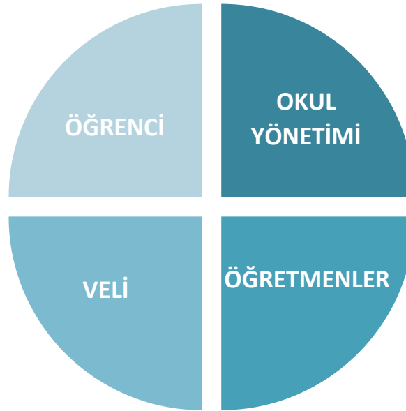
Şekil 1: Okul Temel Paydaşları

Stratejik Planlama sürecinde katılımcılığa önem veren kurumumuz tüm paydaşların görüş, talep, öneri ve desteklerinin stratejik planlama sürecine dâhil edilmesini hedeflemiştir. Bu kapsamda Şehit Cengiz Topel İlkokulu faaliyetleriyle ilgili sunulan hizmetlere ilişkin memnuniyetlerin saptanması, kuruma ilişkin beklentiler, kuruma ilişkin durum tespiti, kurumsal iş birliği ve eşgüdüm, GZFT, önerilerin tespiti vb. konular hakkında Şehit Cengiz Topel İlkokulu Stratejik Planlama Ekibi ile toplantılar düzenlenmiş ve kurumumuzun temel paydaşları olan öğrenci, veli ve öğretmenlerin görüş ve önerilerini almak üzere görüşme ve anket yöntemi uygulanmıştır.